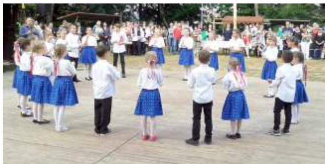
FOTO Z VYSTOUPENÍ DĚTÍ NA HODECH