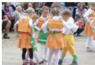
FOTO Z AKCÍ ŠKOLY A ŠKOLKY