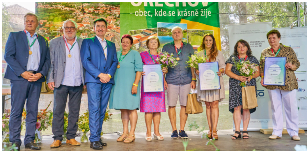
Předávání diplomu za Vesnickou knihovnu Jihomoravského kraje

Vážení a milí spoluobčané, dostává se vám do rukou další číslo Zpravodaje roku 2024, kde bych vás rád seznámil s aktivitami, které proběhly v letních měsících a s plánovanými záměry na další období. Věřím, že jste si léto užili, strávili příjemnou dovolenou, děti si odpočinuly od školních povinností, dospělí od denního shonu a pracovních povinností. Počátkem měsíce června proběhla kontrola hospodaření obce, tzv. audit, s jehož výsledkem byli občané seznámeni na zasedání zastupitelstva, které bude ještě zmiňováno. Nejvýznamnější společenskou akcí však byla účast naší obce v krajské