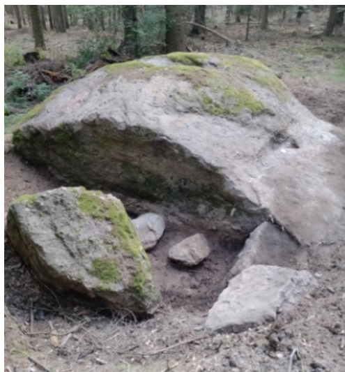
Geologická památka Rozštípený kamen